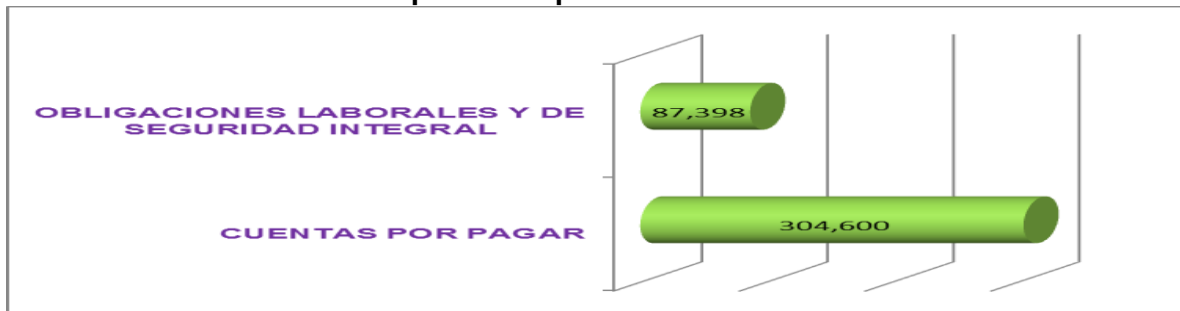
Distribución del pasivo porcentualmente a 31 de diciembre de 2019